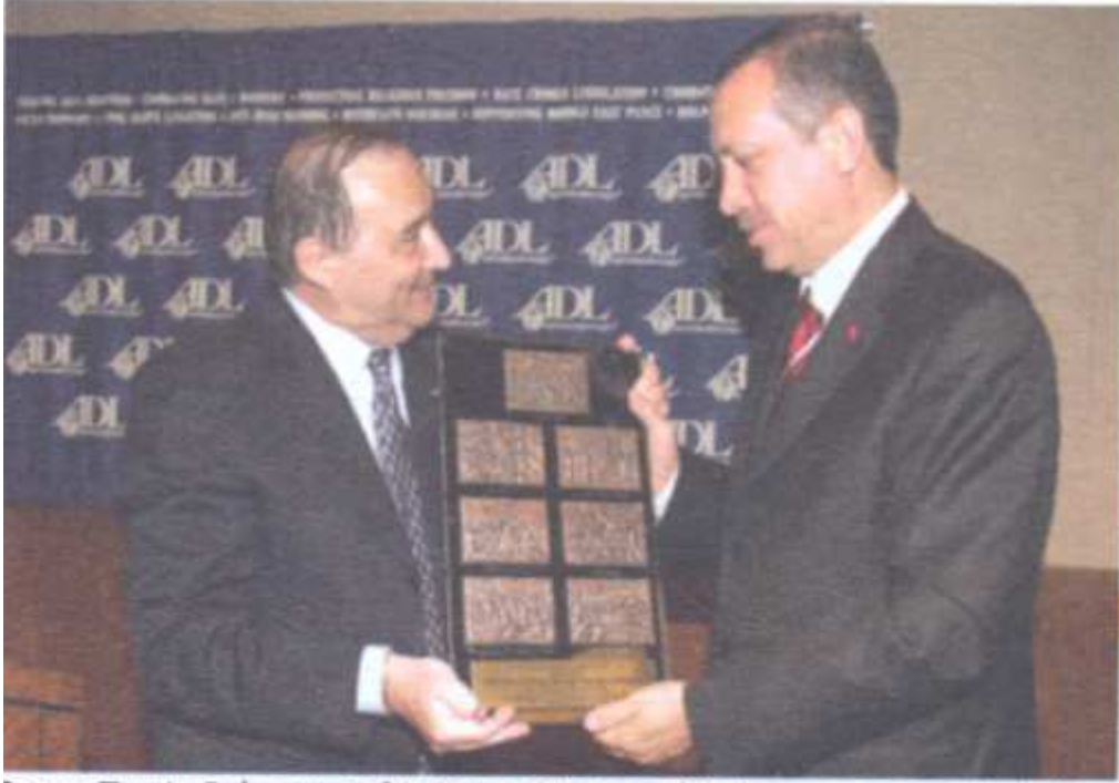
Recep Tayyip Erdogan, right, Prime Minister of Turkey, was presented with Anti-Defamation League's "Courage to Care Award" in recognition of the heroic rescues of Jews by members of the Turkish Diplomatic Corps during World War II. The award was presented by Abraham Foxman, left, ADL National Director at ADL Headquarters in New York.